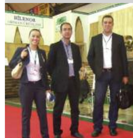
Από την επίσκεψη στις εκθέσεις της Τουρκίας

Κάθε χρόνο στελέχη της εταιρείας μας επισκέπτονται σημαντικές κλαδικές εκθέσεις ώστε να ενημερωθούν για τις τρέχουσες εξελίξεις αλλά και για να διευρύνουν τις επιχειρηματικές σχέσεις της Alfa Wood. Φέτος στελέχη της εταιρείας επισκέφθηκαν 4 γνωστές εκθέσεις που πραγματοποιήθηκαν σε Τουρκία, Σερβία και Ιταλία.